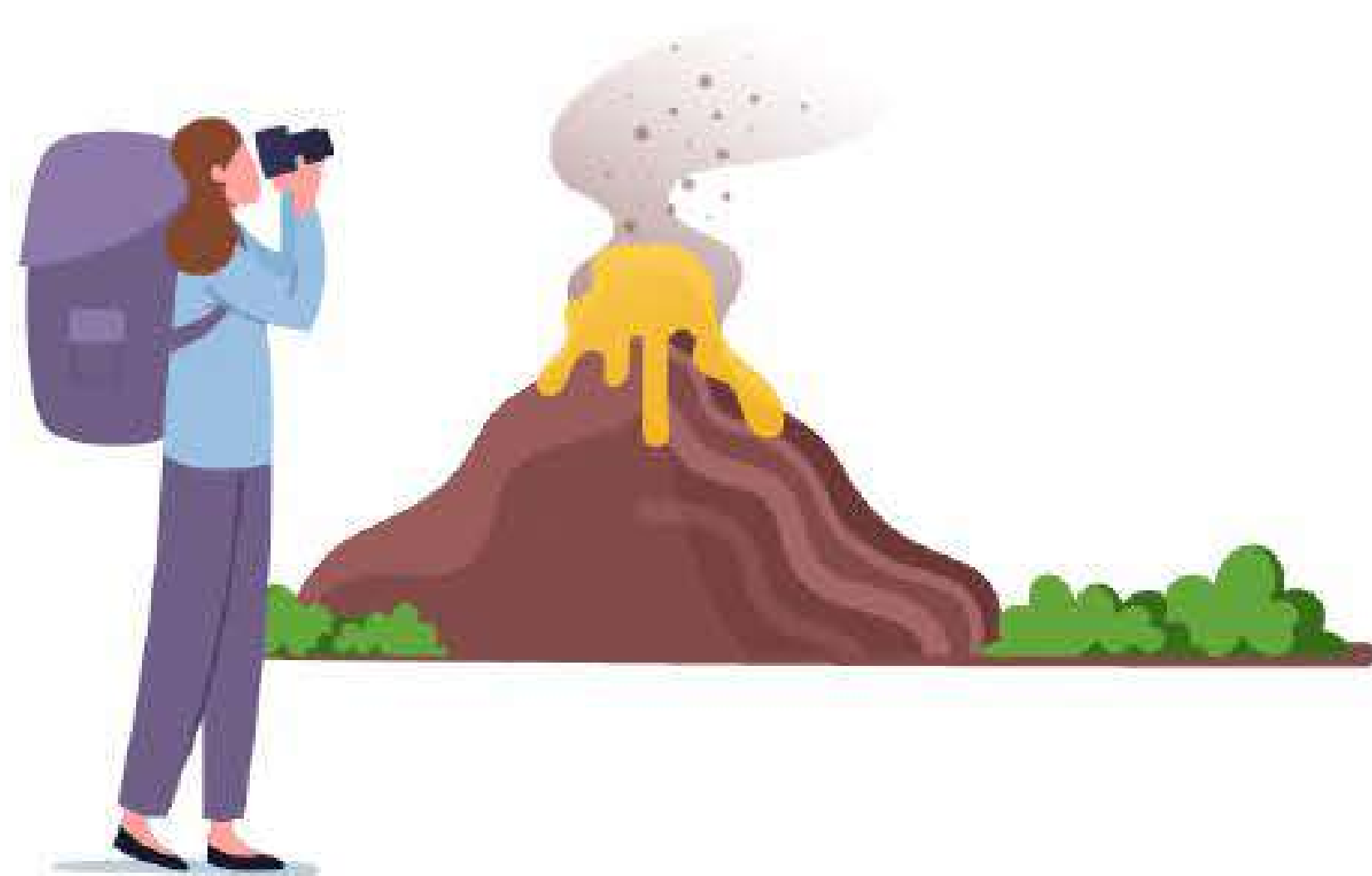
Turisti stranieri Uomini - Donne 25 - 65+