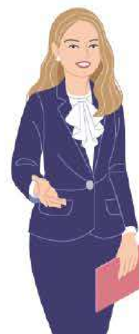
Italiani in visita, per lavoro o piacere Uomini - Donne 25 - 65+