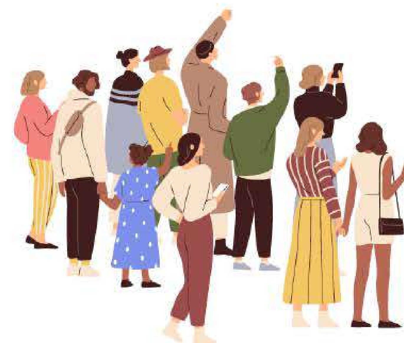
Catanesi e Siciliani interessati a trovare eventi, ristoranti e a conoscere curiosità della città Uomini - Donne 25 - 65+